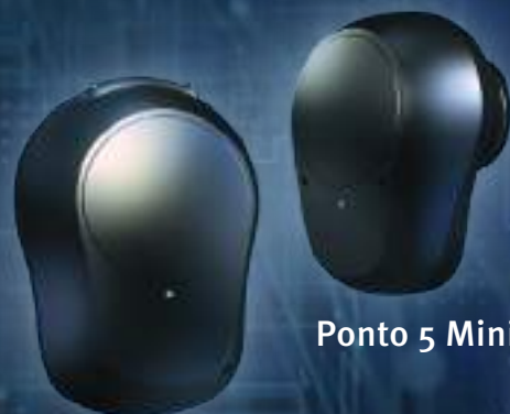
Ponto 5 Super Power

Para más información llama al 649 160 788