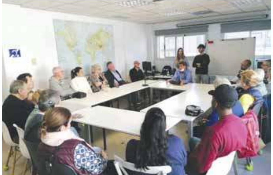
Sesión grupal de intercambio de experiencias con personas candidatas a IC y personas ya implantadas.

Actualmente el número de personas implantadas postlocutivas que se atienden desde nuestra fundación es de 66 y va en aumento año tras año. Aun así, el número de personas implantadas sigue siendo muy pequeño y esto hace que los portadores de implantes cocleares muchas veces tengan la necesidad de