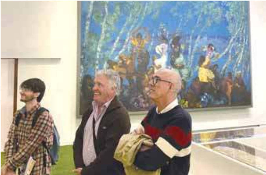
Personas atendidas durante la visita cultural a Caixa Forum.

Como consecuencia de esto tenemos una repercusión emocional directa ya que las personas con pérdida auditiva ven que por mucho esfuerzo que pongan de su parte les es muy difícil llegar a comprender en determinados contextos, y por lo tanto, difícilmente se sentirán incluidos en los lugares a los que asisten.