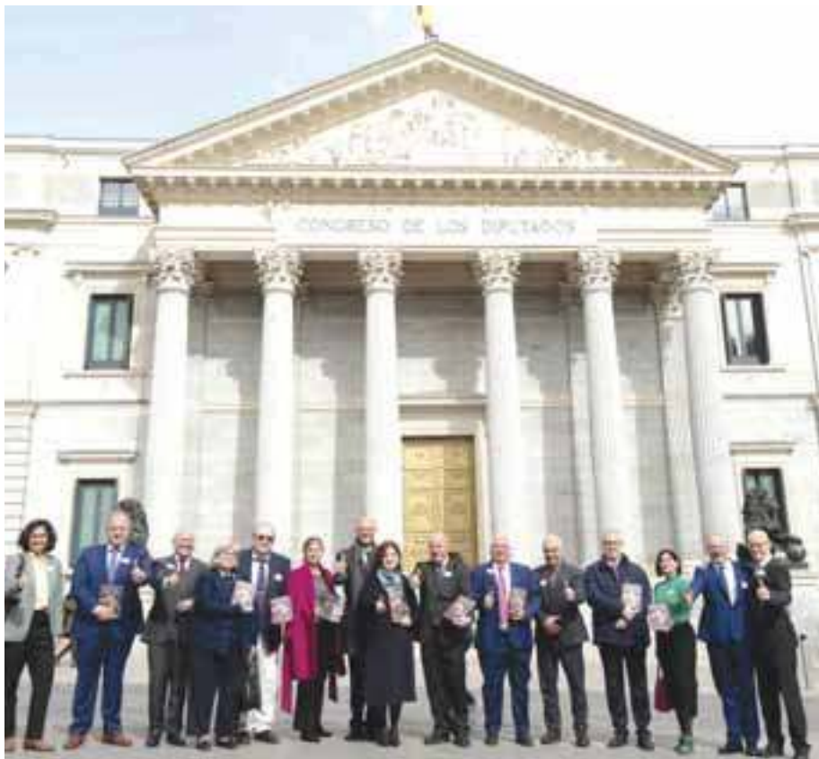
Autores y colaboradores del Libro Blanco en el día de su presentación en el Congreso de los diputados.

y de la administración y representantes de las principales asociaciones de usuarios (Fiapas y Federación AICE). Este libro blanco fue presentado a la Comisión de Sanidad del Congreso de los Diputados el pasado 21 de febrero de 2023, coincidiendo con la semana del Día Internacional de Implante Coclear.