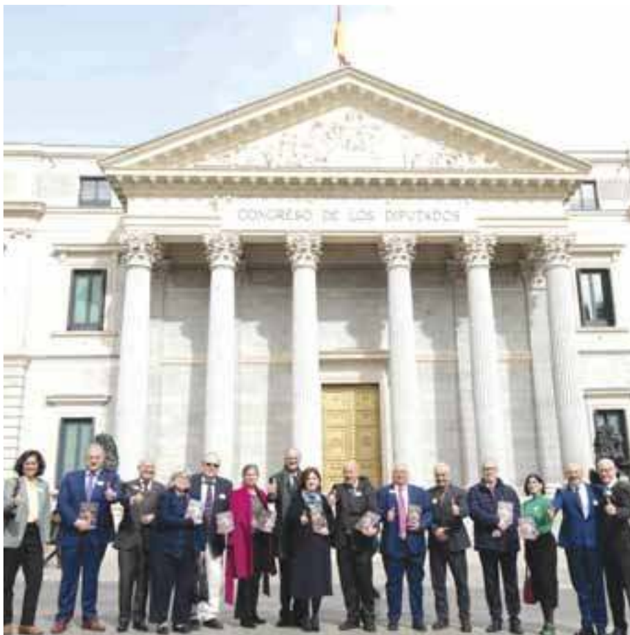
Autors i col·laboradors del Llibre el dia de la seva presentació al Congrés dels Diputats.

representants de les principals associacions d'usuaris (FIAPAS i Federació AICE). Aquest llibre blanc va ser presentat a la Comissió de Sanitat del Congrés dels Diputats el passat 21 de febrer de 2023, coincidint amb la setmana del Dia Internacional d'Implant Coclear.