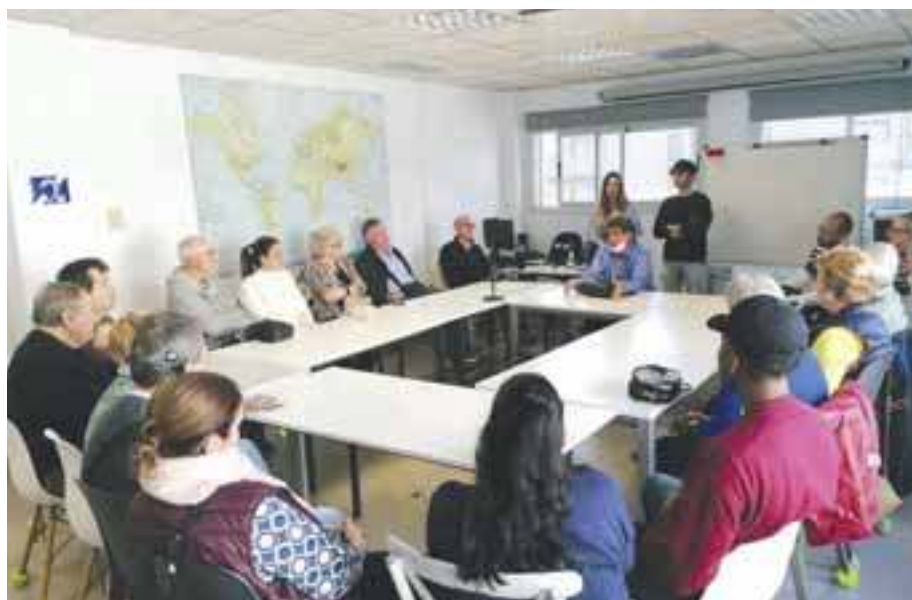
Sessió grupal d'intercanvi d'experiències amb persones candidates a IC i persones ja implantades.

Actualment el nombre de persones implantades postlocutives que s'atenen des de la nostra fundació és de 66 i va en augment any rere any. Així i tot, el nombre de persones implantades continua sent molt petit i això fa que els