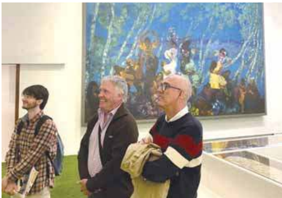
Persones usuàries durant la visita cultural a Caixa Fòrum.

Les limitacions que imposen les barreres comunicatives han donat peu en el context del taller a iniciatives orientades a pal·liar-les. Un exemple d'això ha estat el mapatge de llocs en els quals es troba un bucle magnètic. A partir d'aquí, s'han