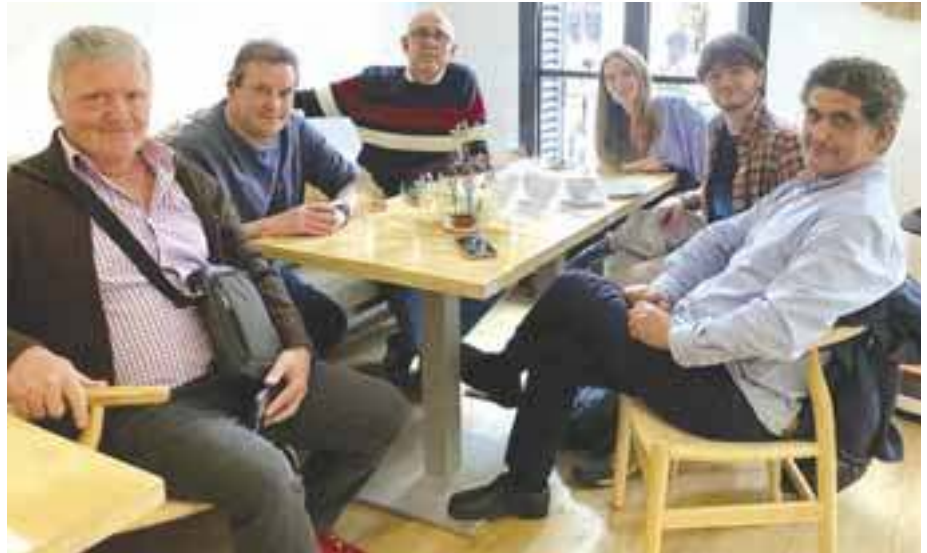
Moment distès després de la visita cultural a Caixa Fòrum, per a valorar millores en accessibilitat.

passen per aquest procés és el gran esforç que fan per millorar i aprendre sobre la seva audició, perquè totes comparteixen una visió cap a un futur millor. A l'inici aquest esforç es veu correspost amb ràpides i significatives millores quant a audició, atès que es troben en una etapa crítica d'estimulació de l'implant, i la rehabilitació sempre es fa en un entorn acústic controlat, fent més notoris els seus avanços. Desafortunadament arriba un moment en el qual tot el progrés que han aconseguit es veu minvat en moltes situacions del dia a dia com ara: anar al supermercat a comprar, assistir a classes, treballar, fer