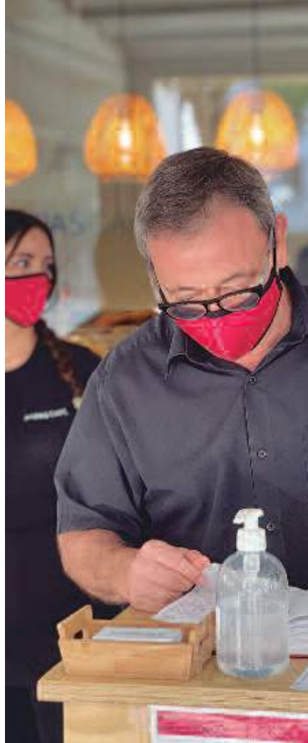
Menús para llevar