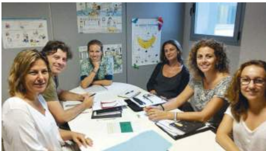
Equip tècnic de l'IMAS i Fundació ASPAS.

El 31 de juliol de 2018 es va signar el primer concert social del Servei d'Atenció Integral i Promoció de l'Autonomia per a persones amb discapacitat auditiva entre l'IMAS i l'entitat ASPAS amb un total de 190 places. La pròrroga d'aquest concert, amb una durada també de dos anys, es va signar de nou el 31 de juliol de 2020 i durarà fins l'any 2022. Aquest servei beneficia a infants des dels 7 anys (al finalitzar el servei d'atenció primerenca) i adults sense límit d'edat amb una discapacitat sensorial auditiva.