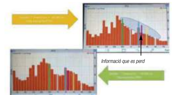
Gràfica 2: representació per freqüències del so "I" masculí que es projecta a uns 65dB amb i sense mascareta.

Per tot el que acabem d'exposar, només incorporant l'ús de les mascaretes, podem concloure que l'accés a la informació es veurà afectat en pràcticament la totalitat de les persones amb discapacitat auditiva.