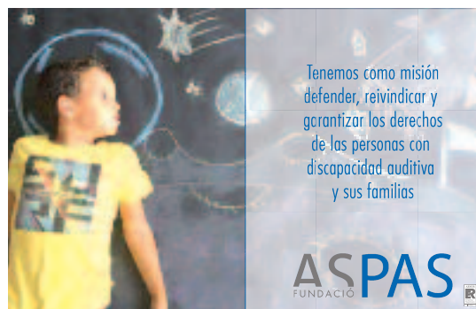
Carátula del díptico.

Dentro del Sistema de Gestión de la Calidad de la Fundación y en el marco del Plan Estratégico y Operativo para el año 2018 de Fundación ASPAS, se aprobó un objetivo estratégico para mejorar la comunicación, participación e imagen corporativa de la Fundación.