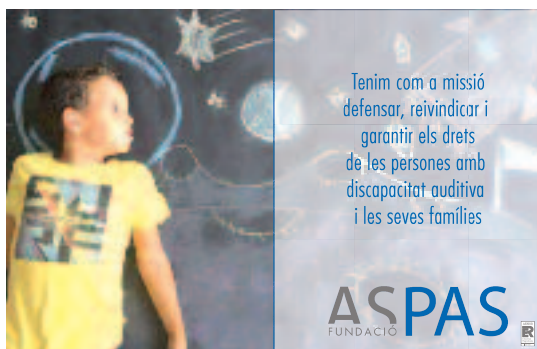
Caràtula del díptic.

Per contribuir a la consecució d'aquest objectiu, l'Ajuntament d'Inca ens va concedir una subvenció per a un projecte que presentem a la convocatòria d'entitats socials de l'Ajuntament d'Inca.