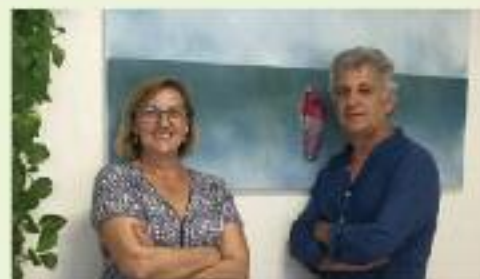
Especialistes en audiologia infantil.

Volem fer la vida més fàcil als nens. Volem "Escoltar" com creixen.