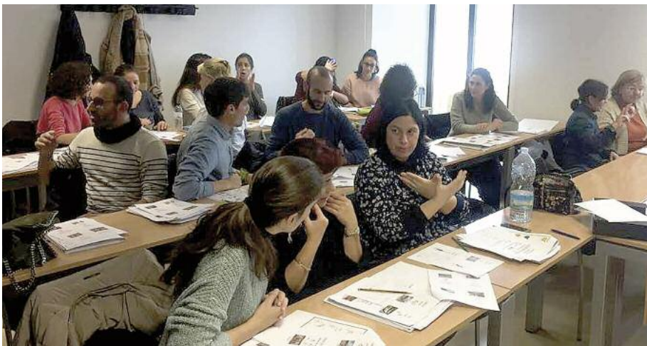
Curs UVAI a Eivissa.

emissores FM. Cal destacar que a Eivissa la formació va tenir una durada de 30h, degut a que aquesta es va ampliar amb la realització d'un pràcticum de comunicació bimodal.