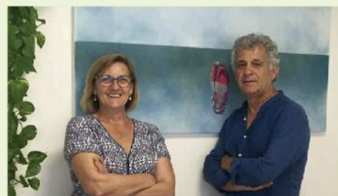
Especialistes en audiologia infantil.