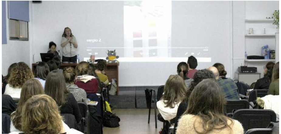
Curs UVAI a Mallorca.

L'objectiu de les accions formatives va ser oferir informació sobre la discapacitat