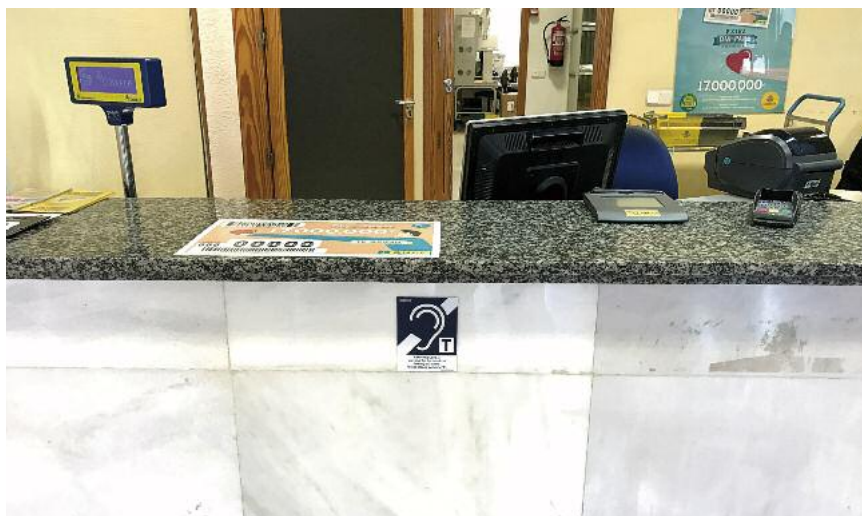
Oficina de Correus a Ciutadella (Menorca).

D'altra banda, es van instal·lar dos bucles a l'Ajuntament de Calvià, un a la sala de plens i un altre de taulell en el punt d'atenció al ciutadà.