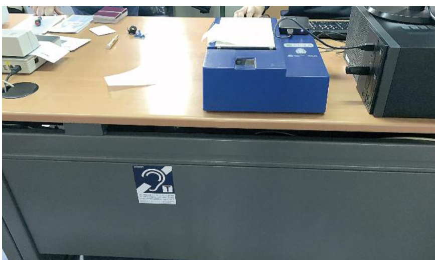
Prefectura de la Policia Nacional a Maó (Menorca).