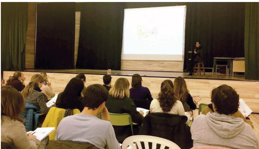
Curs de Formació a Menorca.

Aquests tres cursos estan emmarcats dins de les accions que es duen a terme des del servei UVAI (Unitat Volant d'Atenció a la Integració) que Fundació ASPAS duu a terme a través de la col·laboració i el finançament de la Conselleria d'Educació, Cultura i Universitats. Aquest servei té com a finalitat donar resposta a aquelles dificultats que poden aparèixer als centres educatius a l'hora de treballar amb l'alumnat que presenta necessitats educatives especials associades a la discapacitat sensorial auditiva.